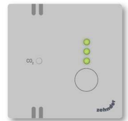
Stand 3 (hoog)