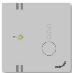
Automatisch CO 2 gestuurd