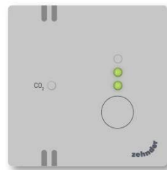
Stand 2 (midden)