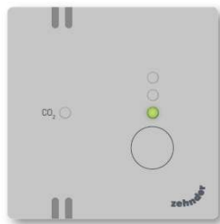
Stand 1 (laag)