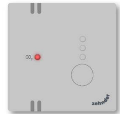
Alleen een melding bij te hoog CO 2